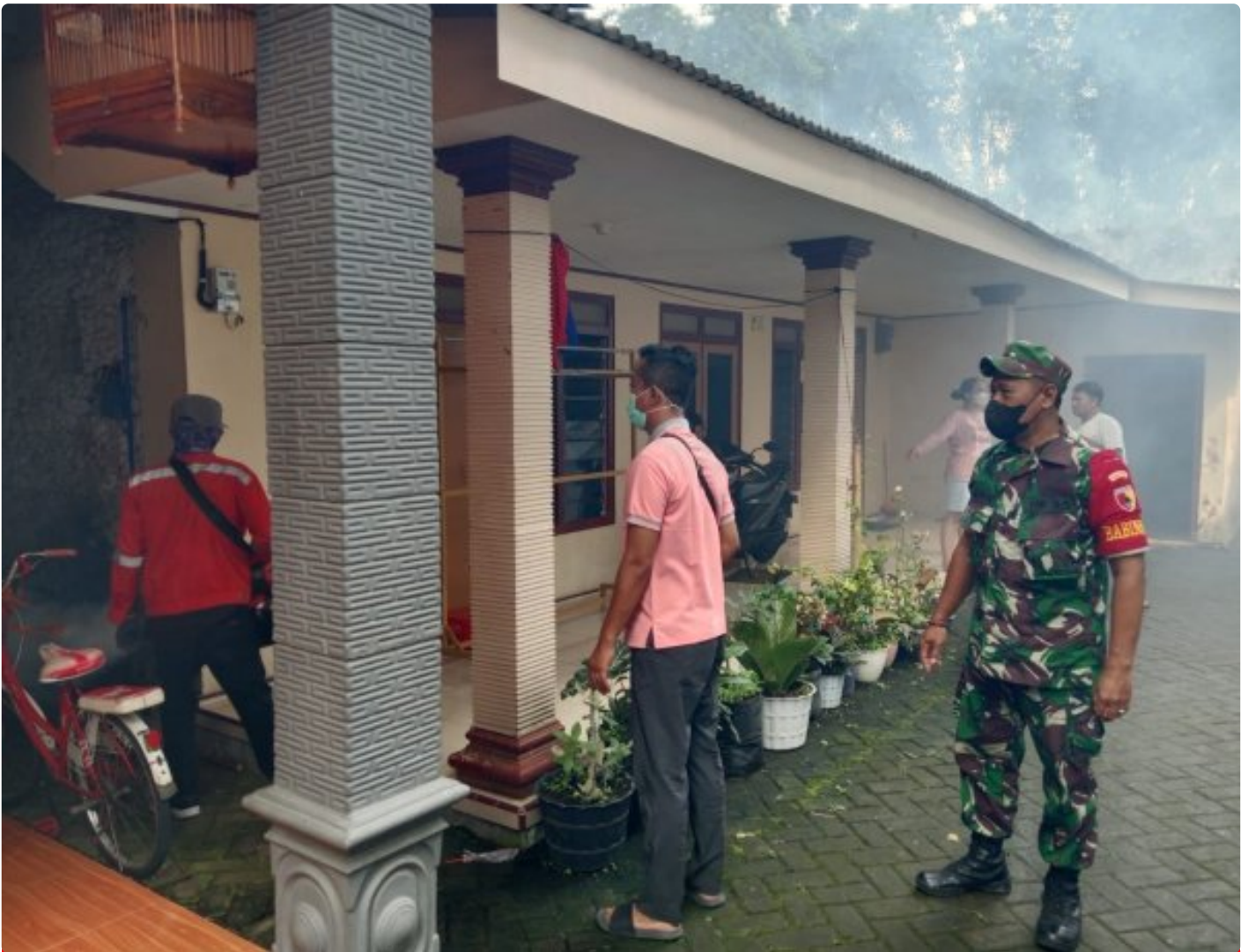
Babinsa Bersama Dinkes Dampingi Fogging, Cegah DBD di Wilayah Desa Binaan

Magetan. Babinsa desa Buluharjo, Koramil Tipe B 0804/02 Plaosan Serka Eko bersama dengan Dinas Kesehatan, Kepala desa Buluharjo dan Perangkat desa melaksanakan antisipasi potensi wabah penyakit demam berdarah akibat dari musim hujan di lokasi pemukiman warga RT 01 s/d RT 03 yaitu dengan cara melakukan fogging atau pengasapan (Pengasapan Pestisida nyamuk) Demam