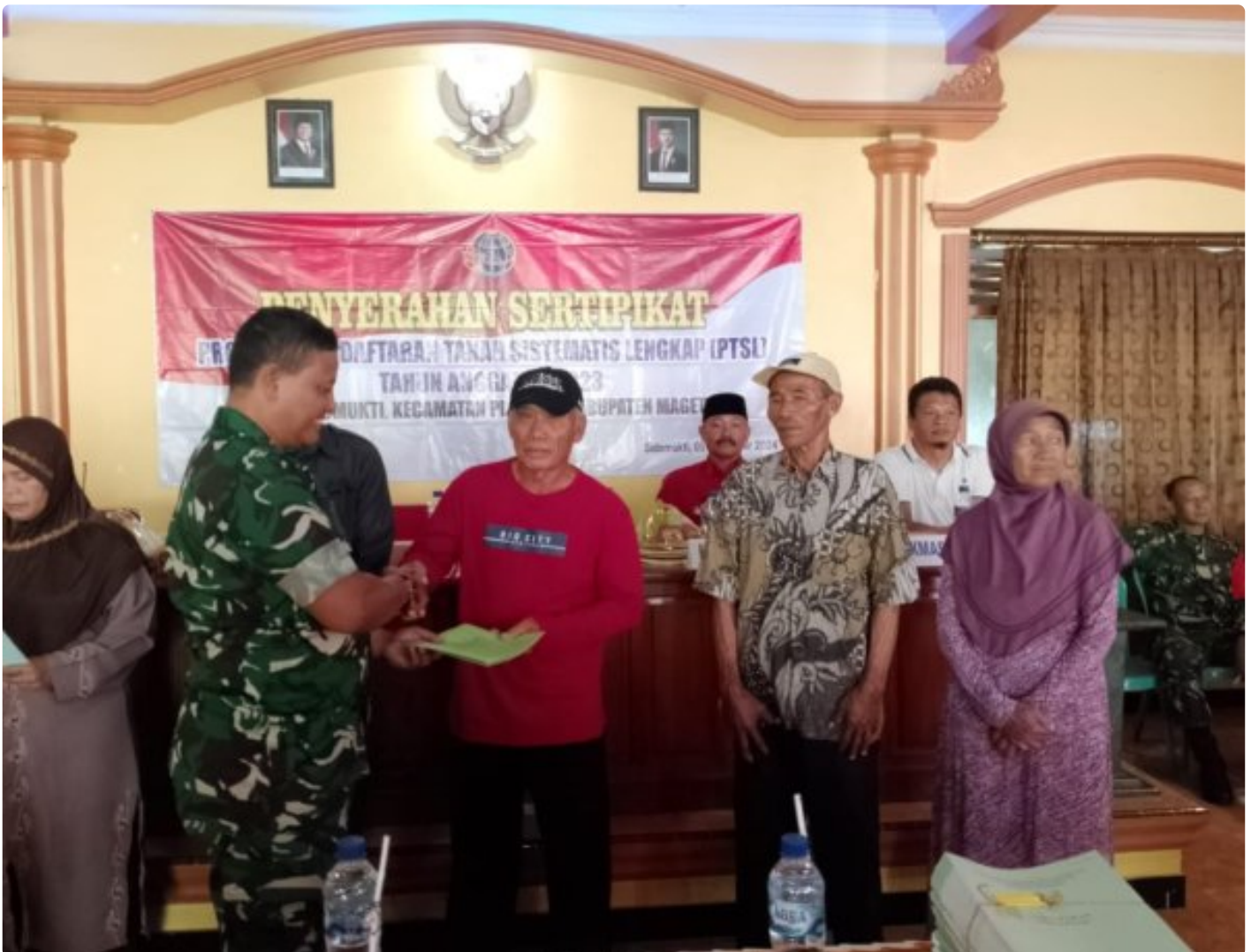
Danramil 0804/02 Plaosan Hadiri Penyerahan Sertifikat Program Pendaftaran Tanah Sistematis Lengkap (PTSL) Desa Sidomukti

PLAOSAN. - Desa Sidomukti melalui Badan Pertanahan Nasional (BPN) melakukan penyerahan Sertifikat Tanah Program Pendaftaran Tanah Sistematis