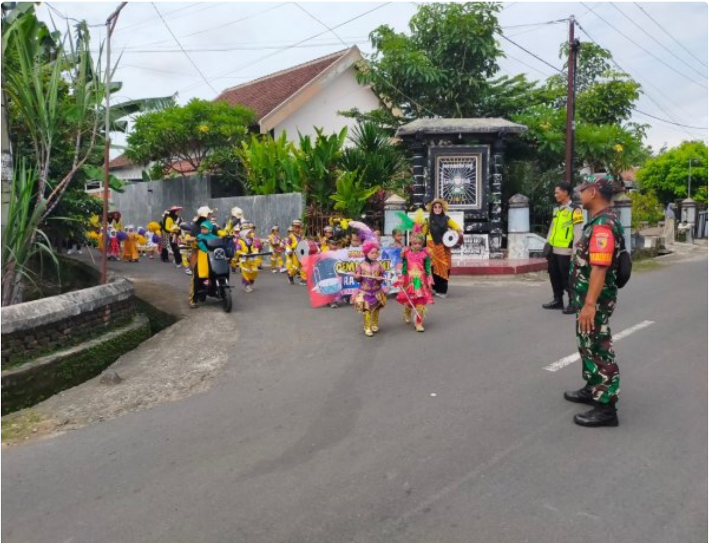
Gebyar Rojabiyah RA dan MI, Babinsa bersama Bhabinkamtibmas Amankan Jalannya Kegiatan Parade Drum Band