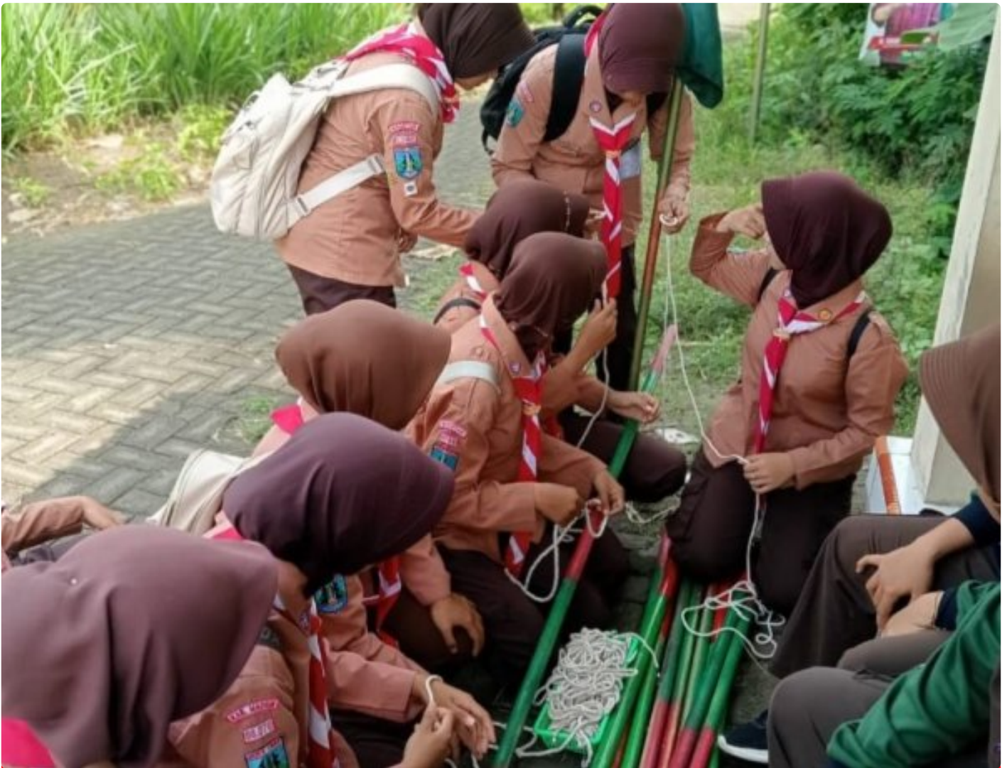
Saka Wira Kartika Koramil 0804/08 Barat Gelar Penjelajahan Dalam Penempuhan SKK

Magetan. - Saka Wira Kartika Koramil Tipe B 0804/08 Barat menggelar kegiatan penjelajahan penempuhan SKK di wilayah Koramil Tipe B 0804/08 Barat dan sekitarnya. Kegiatan ini bertujuan untuk memperkuat jiwa kepemimpinan, kedisiplinan, serta semangat cinta tanah air di kalangan peserta. Selasa (10/12/2024)